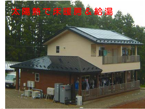
男子寮 B 棟 (完成 2013年) 集熱面積 24 m 2 蓄熱床面積 約 84 m 2 貯湯タンク 670 L