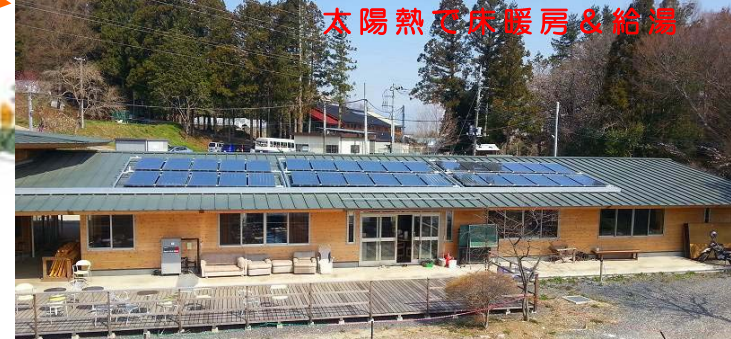
チャペル (完成 2014年) 集熱面積 27.2 m 2 蓄熱床面積 約 80 m 2 貯湯タンク 370 L