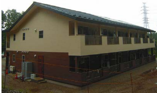
太陽熱で床暖房 & 給湯