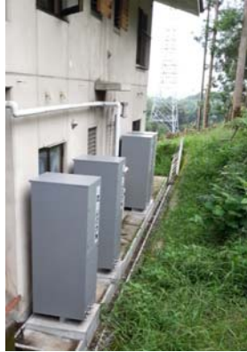
女子寮 (完成 2013年) 貯湯タンク 1,200 L